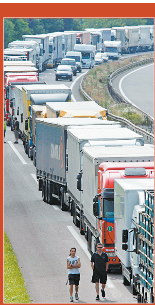
6月30日,在法国斯特拉斯堡附近,一条公路被卡车堵塞。当天,法国大批卡车司机在法国多个城市以堵塞道路的方式抗议油价上涨,并要求政府支持运输行业。

谈及赴台旅游的大陆游客人数问题时,祝善忠说,根据两会签署的有关协议,接待一方旅游配额以平均每天3000人次为限。组团一方视市场需求安排。第二年双方可视情协商作出调整。