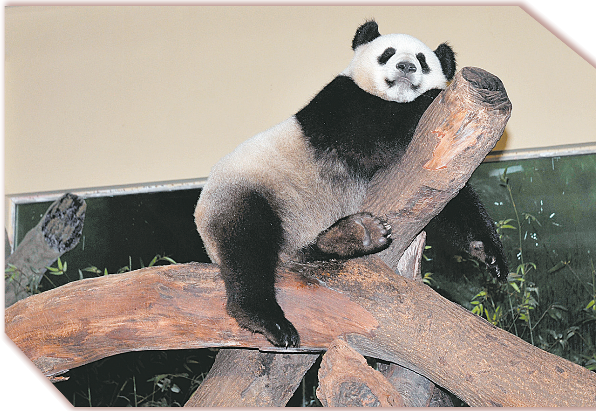
6月30日,一只来自四川的大熊猫在广州香江野生动物世界中国馆内休息。6月26日被转移到广州的5只来自四川地震灾区的大熊猫“仙女”“耀耀”“丽丽”“婷婷”和“白杨”,目前在广州香江野生动物世界工作人员的悉心照料下,正逐步适应在广州新家的生活。

受到中央组织部表彰的54个抗震救灾先进基层党组织代表、57名抗震救灾优秀共产党员、6名被追授为抗震救灾优秀共产党员的亲属代表出席座谈会。