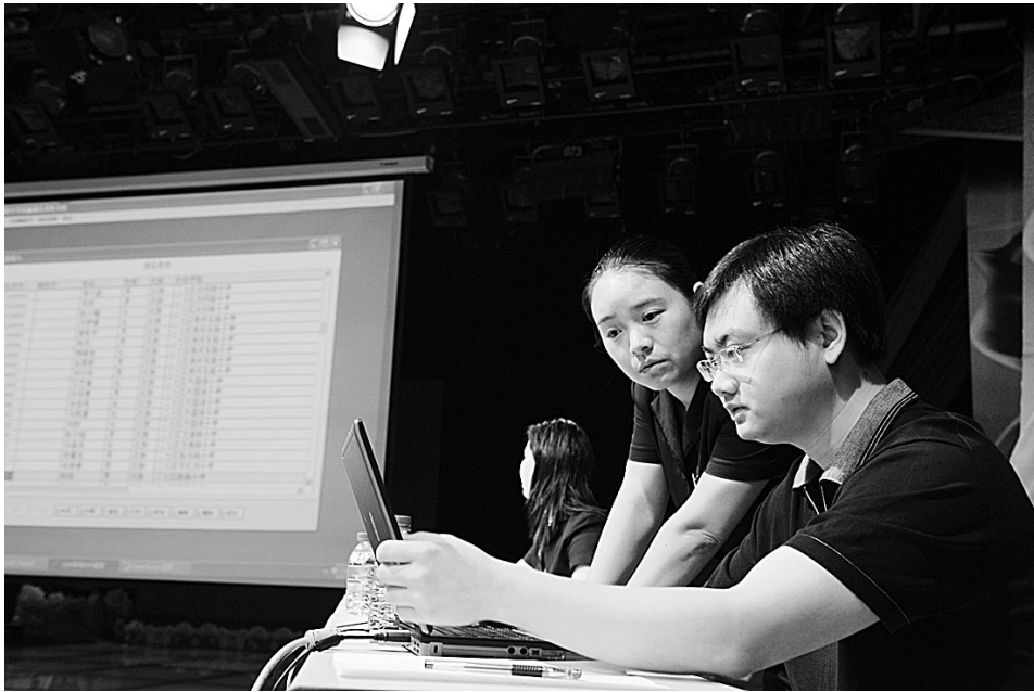
在公证人员的监督下,工作人员将所有考生编号通过程序重新生成新的排序代码。

派位现场,200名学生家长代表是全场的焦点,而3:1的录取比例注定每名推荐生的命运将不尽相同。