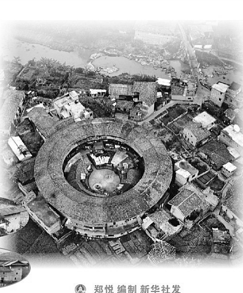
郑悦 编制