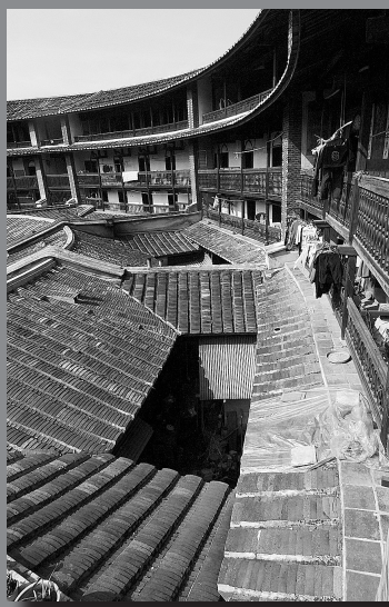
福建南安土楼内景