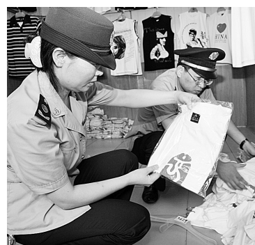
昨日,二七工商分局一马路工商所执法人员对敦睦路服装批发市场销售带有奥运标志服装的商户进行了突击检查,对一些“三无”产品予以查扣。

数条和户口本进行复查;如果分数条遗失,则不予办理复查登记,但可以在13日以后,回原学校开具相关证明,然后持户口本、准考证、证明书到市招办重新补开分条。此外,今年中招语文考试采用网上阅卷,计算机核分的语文成绩不提供核查,一些考生对此颇有意见。对于语文成绩不提供核查的质疑,该负责人解释称,今年的语文考试采用计算机核分,准确率达到100%,考生可以放心。