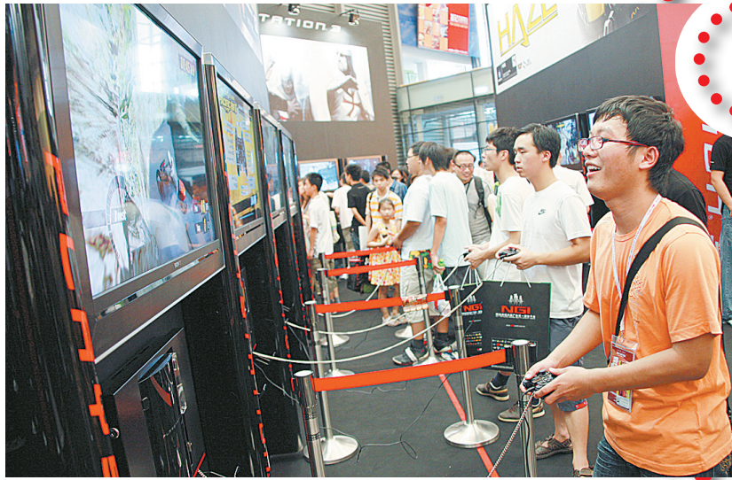
7月17日,为期三天的第六届中国国际数码互动娱乐展览会(ChinaJoy)在上海新国际博览中心开始举行。本届展会面积达3.5万平方米,来自国内外的170多家游戏企业参展。