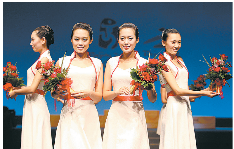
模特展示北京奥运会颁奖花束。

清华大学美术学院设计的颁奖台采用分体式结构,每组颁奖台由七个基本单元组合而成,整体为中国传