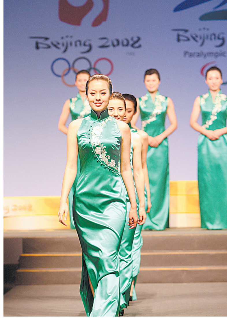
模特展示北京奥运会颁奖礼仪服饰。

颁奖花束还选用了6支火龙珠、6支假龙头、6片芒叶、6片玉簪叶、6片书带草为配花配叶。颁奖用花的蝴蝶结以中国丝绸为材,采用传统中国结的样式制作而成,丝带上面印有北京奥运会会徽。花束的手柄采用金