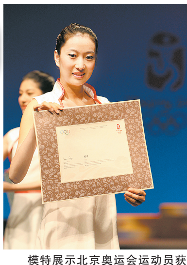
模特展示北京奥运会运动员获奖证书。

北京奥运会颁奖礼仪服装唯一一款男装为升旗手服装:与青花瓷礼服遥相呼应的升旗手服装,在体现中国传统文化的同时又不失阳刚之气,将出现在所有的奥运会和残奥会比赛场馆中。所有的奥运礼服和升旗手制服都绣有“BEIJING 2008”的字样。