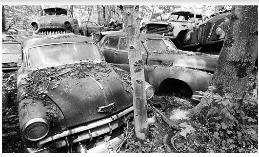
这是27日在瑞士伯尔尼以南的考夫多夫村拍摄的旧车“墓地”一角。这个掩映在树林中的“墓地”已有约70年历史。当地政府已决定,将于2009年3月底关闭这个旧车“墓地”。