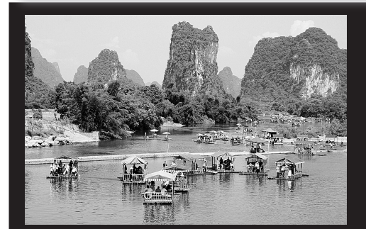
26日,游客在桂林阳朔县遇龙河景区乘竹排游玩。进入暑期,桂林旅游迎来旺季。据统计,近期漓江景区日接待游客量在七千人以上。