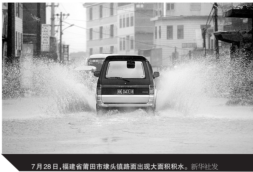
7月28日,福建省莆田市埭头镇路面出现大面积积水。

专家指出,台风登陆后尽管强度将有所减弱,但值得关注的是,如果台风云系和北方冷空气相遇,可能给河南、山东等地带来较强降雨。