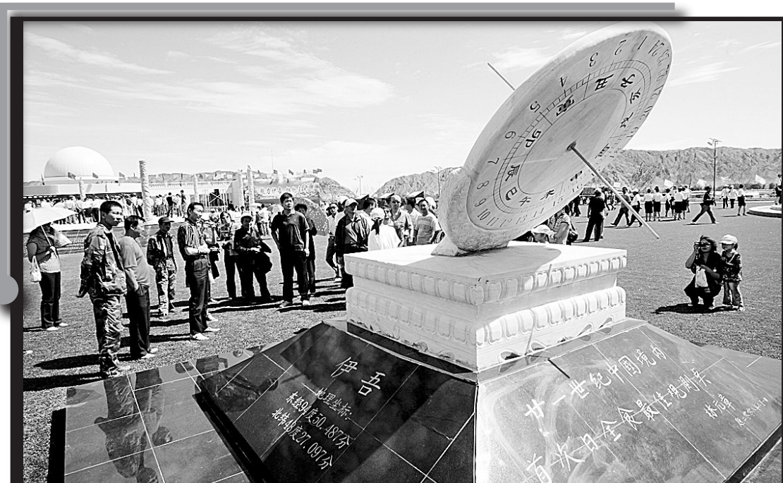
27日,游客在新疆哈密伊吾县苇子峡日全食观测城参观。当日,新疆哈密伊吾县苇子峡日全食观测城竣工迎客。8月1日,中国将自新疆阿勒泰经哈密、酒泉、西安至郑州一线发生日全食,这是21世纪首次发生在中国境内的日全食。伊吾县苇子峡为这次日全食最佳观测点之一。

土耳其政府副总理哈亚特·亚泽哲在爆炸现场告诉媒体记者:“我们知道这是一次恐怖袭击,但由哪个组织负责,我们还没有这方面信息。”(史先振 新华社特稿)