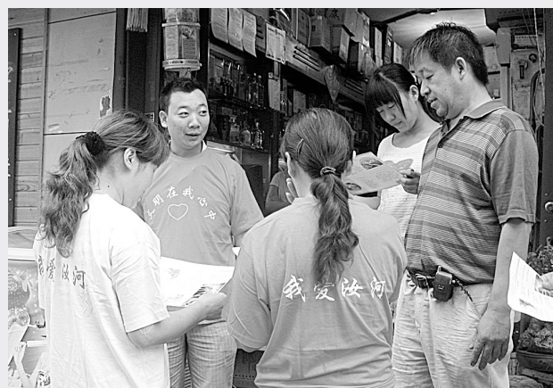
为深入开展“讲文明、迎奥运、树新风”活动,汝河路办事处制作1万多件印有文明用语的文化衫,向辖区楼院长、创建志愿者和楼院管理人员发放。