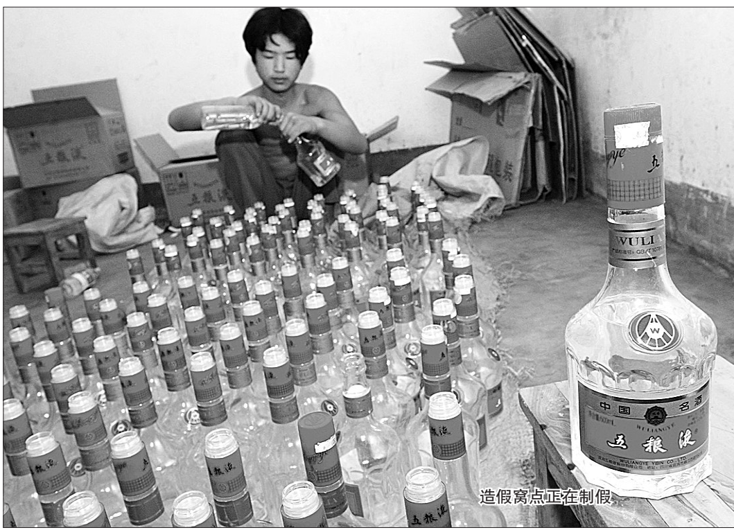
造假窝点正在制假

为了保证品相完好,这些长期收购高档酒瓶的贩子也偷偷地“培训”酒店服务员,开酒瓶子要注意别损坏了防伪标签。王某举例说,比如开剑南春新包装酒,要从瓶子底部开,打开拉环的价格就大打折扣,那样他们只收拉环,一套拉环10元。经常游走在高档酒店的小贩子,对哪些酒店经常有高档酒瓶也了如指掌,