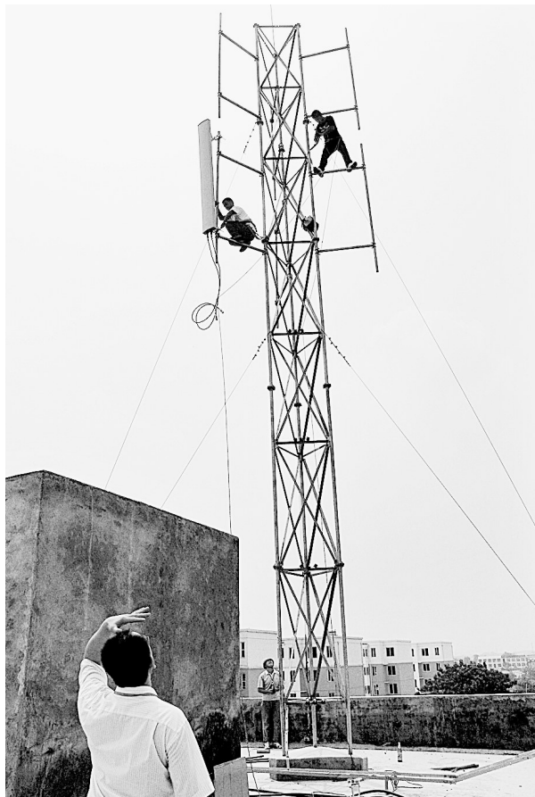
郑州冯湾基站现场,联通工作人员正在进行紧张施工。

“让目标感动自己,以行动感动客户”。走在电信改革前沿的郑州联通人,将以“客户的事情是最大的事情”为服务理念,以“让一切自由连通”的品牌信念,与数以百万消费者携手奋进,共同努力开创更加灿烂辉煌的明天!