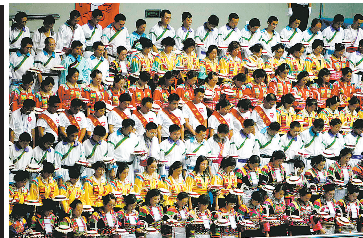
为在四川地震中遇难的同胞默哀。