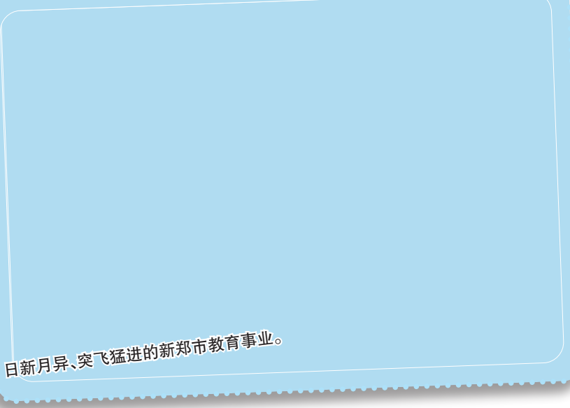
日新月异、突飞猛进的新郑市教育事业。