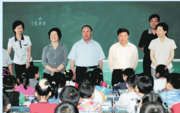
新郑市四大班子领导慰问师生(自左至右依次为:副市长景雪萍、人大常委会主任高林华、市委书记赵武安、市长吴忠华、政协主席陈莉)。