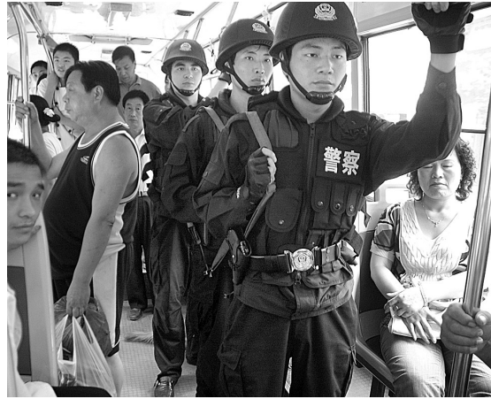
为进一步强化奥运安保工作措施,8月4日上午,登封市警方将武装巡逻活动从各景区、公园延伸到公交车、城乡客车等人员密集区域,尤其是从市区发往少林寺、中岳庙和高阳书院等景点的公交车和客车,确保乘客安全。

围绕打造“国际文化旅游名城”的目标,加快推进文化旅游发展新跨越,延伸文化、旅游产业链条,构筑以文化旅游为龙头、以生产型和生活型服务业为两翼、结构合理、功能完善的现代服务业体系。 以新理念推进农业发展新跨越。坚持以现代农业示范园区支撑,以无公害农业生产基地为依托,积极引进和推广农业新品种、新技术,大力发展旱作农业、特种养殖业。加快建设和形成具有登封特色的无公害蔬菜基地、小杂粮小果品基地、优质红薯基地、优质烟叶基地、畜牧养殖基地,全面提升农产品的规模。 以新思路推动城乡发展新跨越。在提升城市功能的基础上,着力打造城市特色,加快建设现代化小城镇、新农村,大力推进农村新型社区建设。形成“体制统一、规划统筹、资源共享、利益共得”的城乡一体化发展新格局。