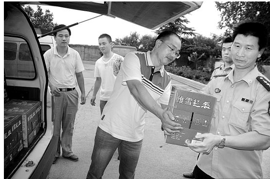
7月31日上午,唐庄乡组织干部职工分9组对139户老复员军人、伤残军人、军烈属和军烈属进行走访慰问。

一是发放独生子女父母奖励费。对全市8805户14周岁以上的独生子女父母发放奖励费105万元,已全部到位;二是办理意外保险。市政府拨付专项资金26万元,对农村14周岁以下独生子女家庭中的母亲8591人及孩子8691人,办理人身意外伤害、附加意外伤害医疗两项保险,截至目前,共受理赔付12期,赔付金额9840.39元;三是拨付四木免费资金。上半年对人口和计划生育服务站投入90万元,保证了计划生育免费技术服务经费及服务站经费全额财政供给。