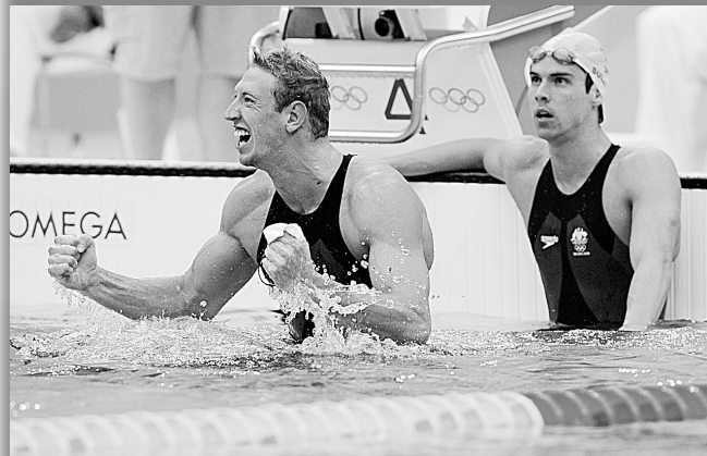
8月14日,在男子100米自由泳决赛中,贝尔纳以47秒21的成绩夺得这个项目的金牌,他的对手沙利文仅以0.11秒的劣势与冠军失之交臂。