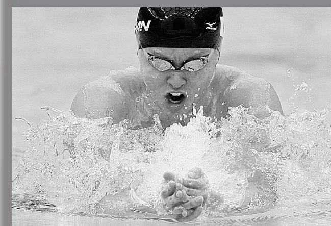
8月14日,日本选手北岛康介在男子200米蛙泳决赛中,以2分07秒64的成绩夺得金牌,并打破奥运会纪录。