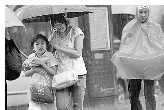
昨日,一场大雨“突袭”北京,虽然影响到了部分奥运比赛,但也确为酷暑中的北京城带来了丝丝凉意和清新的空气。

这几天看了太多失败者的眼泪,有哥伦比亚举重选手那样连续6把早见失误后的痛心疾首,也有朱启南那样本不想哭,却被媒体问得控制不住泪腺的真情流露,当然,还有盛江那样一天之内几度波折后的百感交集。不得不承认,奥运竞技场,像是一个巨大的情感磁场,身处其中,你很难不为之动容。 大家都在哭,我却很怀念李宁的笑。 1988年汉城奥运会,李宁从跳马上落地时,坐在了地上;吊环比赛时,他的脚挂在了一个环上。“体操王子”一下从天上摔回了人间。但他站起时,留给全世界的是一张笑脸,那种笑容,可以让人一辈子记住。 那个年代,有人说:输成这样,羞耻都来不及,还有脸笑?甚至有人给他寄去上吊的绳子。 李宁对这个笑容的解释是:体育比赛总有成功和失败,人不能因为失败就狼狈不堪。胜的时候我喜欢笑,输了我也一样会笑。只不过当时大家不能接受失败的笑容而已。 我们总是忙于歌颂成功者的辉煌,却没时间细想失败者会有更多的人生感悟。李宁在开幕式点火的瞬间,证明了他曾经是中国最伟大的运动员,但他的伟大仅仅是来自于他得到过的三枚奥运金牌吗? 我想,赵颖慧、谭亮这样有过丰富失败经验的选手,他们的生活感悟是那些顺风顺水的运动员不会有的。而朱启南、吴鹏这些近些天遭遇不同挫折的年轻人,其实得到了很大一笔人生财富。 以一个身份之差与第15块奥运奖牌擦肩而过的7届奥运自行车传奇选手,准备骑到伦敦;在25米手枪决赛中陈颖在第21位的塞卡里奇说,她的第6次奥运会经历很愉快。看看那些50多岁甚至60多岁的“老人”吧,他们之所以伟大,并不因为得到多少金牌,而在于——他们都是失败不能打垮的人。 本报北京专电 记者 刘超峰