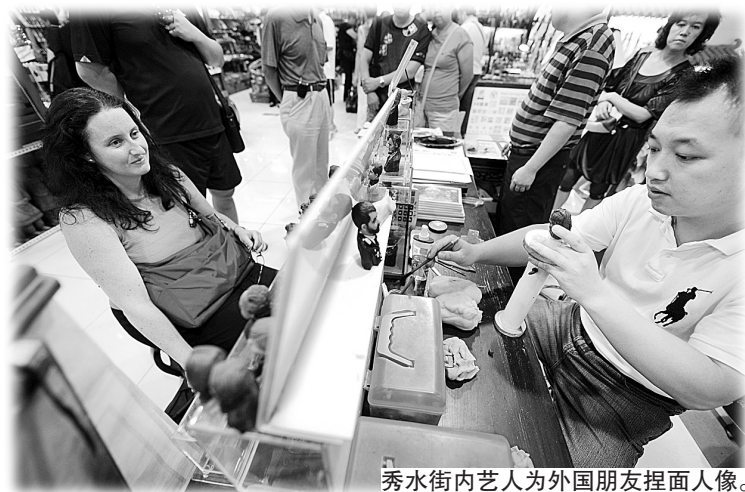
秀水街内艺人为外国朋友捏面人像。