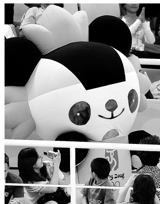
8月14日,福娃“晶晶”来到观众席为选手加油助威。当日,北京奥运会游泳比赛在国家游泳中心——“水立方”继续进行。

本报讯(记者 李晓光)昨日早上,经过一夜的奔波,来自登封市塔沟武校的2200多名少林小子抵京,来到他们的训练基地,备战2008年北京残奥会开幕式排练。 据了解,少林小子参加的2008年北京残奥会开幕式中的表演节目,以演绎中华武术的和谐文化,充分展示少林传统武术的独特魅力为主。为了保证排练节目的质量,参加节目排练的教练员和同学们主动放弃春节、暑假与家人团聚的机会,留校照常训练,虽然学生年龄小,训练强度大,但为国争光的信念时刻鼓舞着大家,不管是寒冷的天气,还是炎热的夏天,没有一个学员请假脱岗的现象。 目前,塔沟武校还有500多名学员正在积极备战奥运会闭幕式的演出,同时学员张帅可将作为中国唯一一名男子散打队员参加奥运会武术散打比赛。