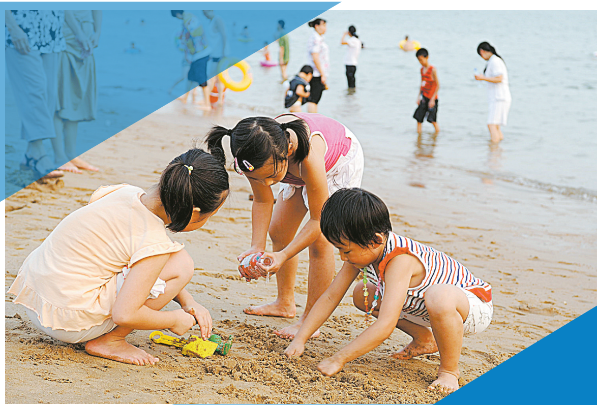
8月19日傍晚,福州市民在江边戏水纳凉。当日11时,福建省气象台再次发布高温橙色预警。气象专家说,福建等南方大部分地区气温从18日开始猛涨,这一波持续高温热浪直接原因是副热带高压造成的,与即将到来的今年第12号台风“鹦鹉”有关。