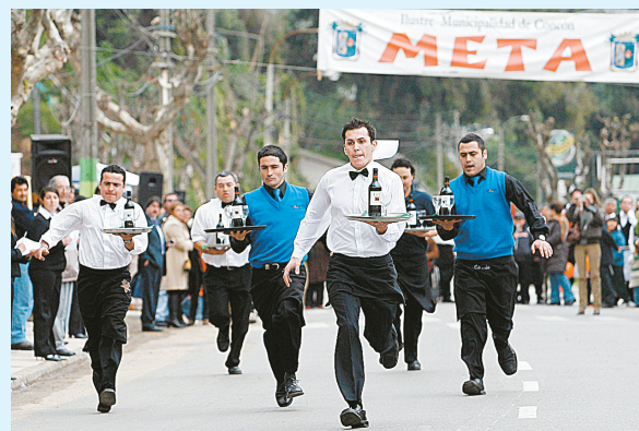
18日,在智利中部的康孔市,服务生手持托盘参加赛跑。当天,康孔市举行了一年一度的餐馆服务生托盘中赛跑,参赛者要托着一瓶酒和两只杯子的托盘中跑一公里,率先抵达终点并且托盘中杯子未倒、酒未洒出的人获胜。

2006年12月,斐济军事领导人姆拜尼马拉马发动政变,推翻原总理领导的政府。2007年5月31日,姆拜尼马拉马宣布解除全国紧急状态。同年10月,他又承诺在2009年3月底以前举行大选,并表示斐济军方将接受任何大选结果。