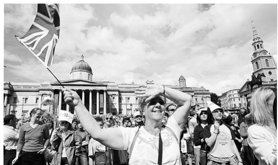
8月24日,英国各地举行盛大活动,庆祝北京奥运会闭幕,奥林匹克会旗移交伦敦。