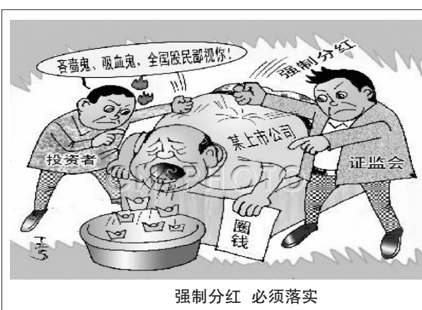
强制分红 必须落实

郎平的道路,给体制转型中的中国教练和运动员提供了典范。她从不抱怨自己的所得少于付出,以一个最“火”的运动明星的身份,甘心情愿从最底层干起,走出一条让人由衷敬佩的道路。说她是“中国第一超女”,不仅因为她是老百姓最喜爱的女运动员,而且因为她确实超越了自己的时代。 薛涌