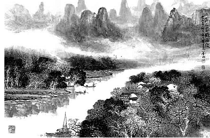
两岸人家微雨后(国画)