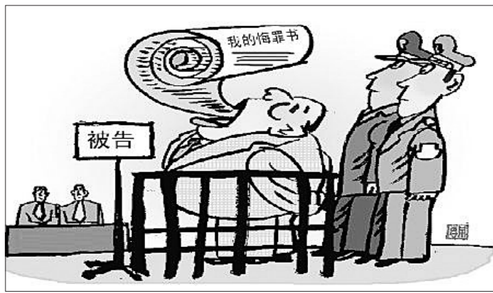
漫画 重庆一贪官庭审时背诵事先准备好的悔罪书。