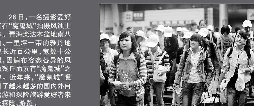
28日,在兰州火车站,一些返校大学生从站前广场经过。当日,兰州火车站日发送旅客近3万人,创该站日发送历史最高值。受进疆摘棉民工流、学生返校流和日常旅客流的影响,兰州火车站自8月24日以来出现运输高峰。均为新华社发

从2006年开始,国资委已连续两年组织中央企业招聘总法律顾问,有11名优秀法律人才通过公开招聘走上企业总法律顾问岗位。