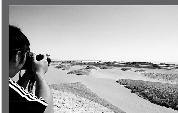
26日,一名摄影爱好者在“魔鬼城”拍摄风蚀土林。青海柴达木盆地南八仙、一里坪一带的雅丹地貌长近百公里,宽数十公里,因遍布姿态各异的风蚀残丘而素有“魔鬼城”之称。近年来,“魔鬼城”吸引了越来越多的国内外自驾游和探险旅游爱好者来此探险、游览。

通知说,2009年前入学的专科层次中西医结合专业学生和2009年前入学的初中起点5年制专科层次中西医结合临床医学专业学生,报名参加医师资格考试,按有关规定执行。