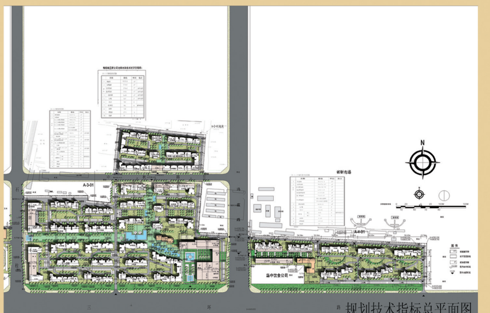
规划技术指标总平面图