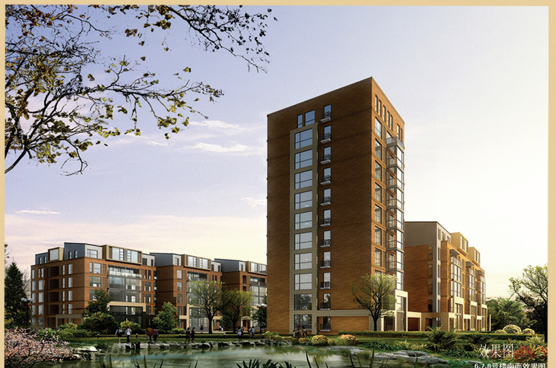
效果图 6、7、8号楼南面效果图