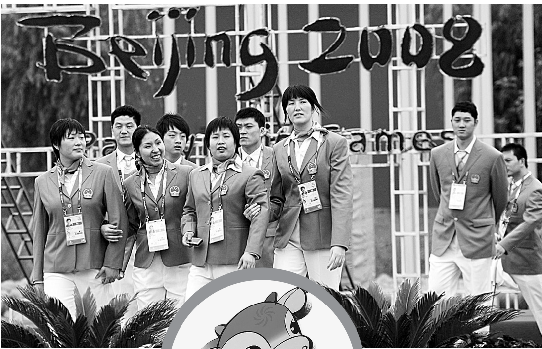
上图 8月30日,中国运动员走进北京残奥村。当日,北京残奥村正式开村。