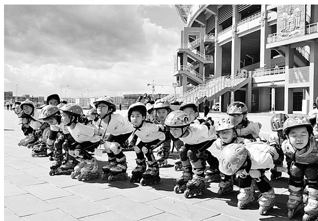
8月30日,儿童们进行轮滑表演,为圣火传递加油。当日,2008年北京残奥会圣火在内蒙古自治区呼和浩特市进行传递。

卡拉季奇7月21日在塞尔维亚境内被捕,7月30日被移送到前南刑庭。他7月31日首次在前南刑庭出庭,受到11项指控,包括种族灭绝罪和反人类罪等,他当时拒绝表态是否认罪。