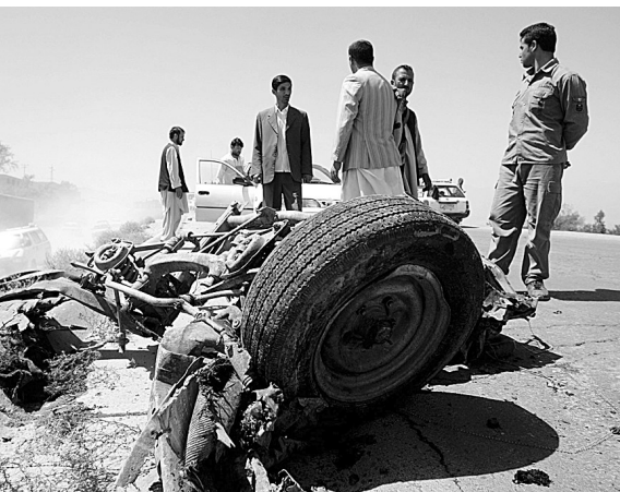
30日,阿富汗官员在首都喀布尔市郊发生自杀式爆炸现场勘查。当日,北约领导的驻阿富汗国际安全援助部队的法国军车遭到汽车爆炸袭击。

美联社报道,祖恩公司总部设于加拿大首都渥太华,经营跨大西洋民航业务,航班主要飞往英国和美国,票价低于大部分航空公司。