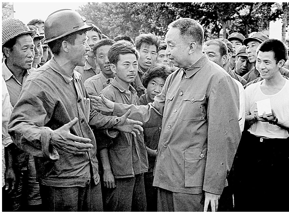
1976年，华国锋同志慰问唐山地震灾区人民。

国务院业务组组长，之后列席中央政治局会议。九一三事件中，在周恩来同志的直接领导下，他参与处理林彪集团问题的工作。同年10月，兼任广州军区政治委员、军区党委书记。1973年7月，任国务院计划生育领导小组副组长。同年8月，在党的十届一中全会上当选为中央政治局委员，协助周恩来同志抓农业工作，使全国粮食生产保持比较稳定的增长。他还在进口成套化肥技术设备，输油输气管道建设，保证市场供应和物价稳定等方面做了大量工作。1975年1月，任国务院副总理兼公安部部长，同年2月，在国务院常务会议上被确定为常务副总理之一。在主管政法和科学等方面工作期间，他认真贯彻中央关于落实干部政策的精神，在分管的部门解放了大批干部。他注重科学技术的发展和高科技人才的培养，并领导和支持高端国防项目的研制攻关工作。1976年1月8日，周恩来同志逝世。2月，根据毛泽东同志提议，中央政治局通过，华