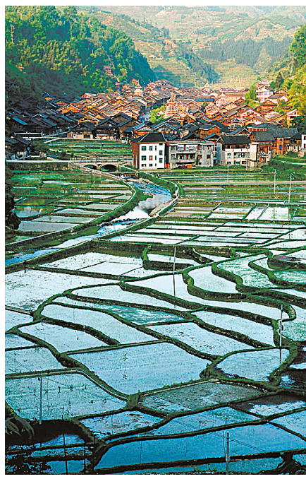
贵州黎平肇兴侗寨

我是不是也有点叶公好龙，或者是人真的有两面性，对某一种事物的爱和恐惧有时也是并存的呢？