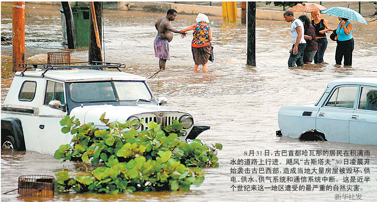
8月31日,古巴首都哈瓦那的居民在积满雨水的道路上行进。飓风“古斯塔夫”30日凌晨开始袭击古巴西部,造成当地大量房屋被毁,供电、供水、供气系统和通信系统中断。这是近半个世纪来这一地区遭受的最严重的自然灾害。

下图 8月31日,美国总统布什在位于首都华盛顿的联邦紧急措施署总部发表讲话。