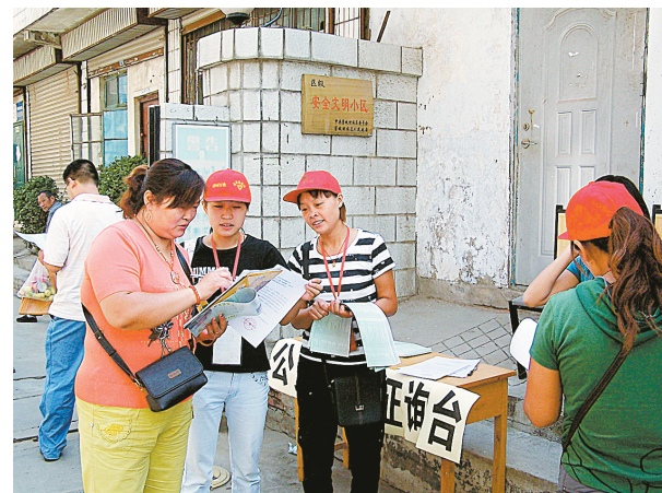
8月31日,公交青年志愿者服务小分队组织500余名队员上站点进社区,发放《郑州公交乘车指南》及征求意见函8000份,广泛征求市民意见和建议。

昨日上午,新密市公安局交警大队二中队事故民警韩丰涛到院了解陈馨的伤情时,得知陈馨为开学学费发愁,民警在与肇事司机联系不上的情况下,先垫付2000元交通事故赔偿款,跑了十几里山路,找到陈馨家,将2000元钱送上,帮助陈馨先解决上学的费用。打好包袱只欠学费的陈馨接过民警送来的钱时,感激地握住民警的手连声说:“谢谢,太感谢了,真是及时雨啊!”