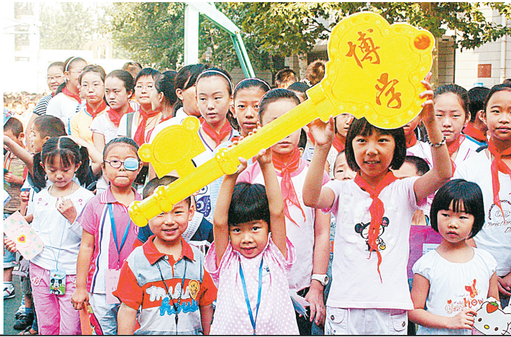
9月1日,在文化路一小的开学典礼上,同学们进行了一次传递“金钥匙”活动。“金钥匙”是博学、勤奋、打开知识大门的象征。“金钥匙”的传递让同学们体验追求知识的快乐。 本报记者 宋晔 摄