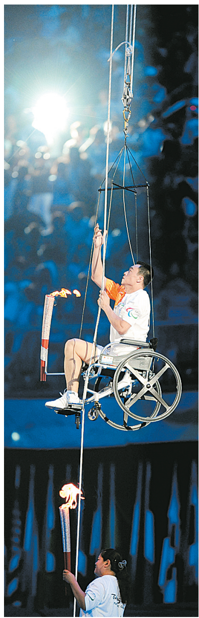
最后一棒火炬手、残奥会田径金牌获得者侯斌(上)准备点燃主火炬。