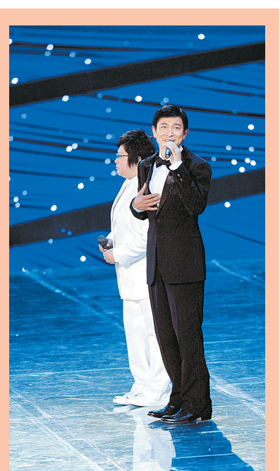
刘德华(右)和韩红演唱主题曲《和梦一起飞》。