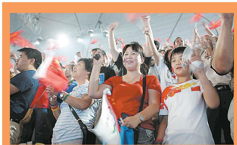
开幕式上兴奋的观众。