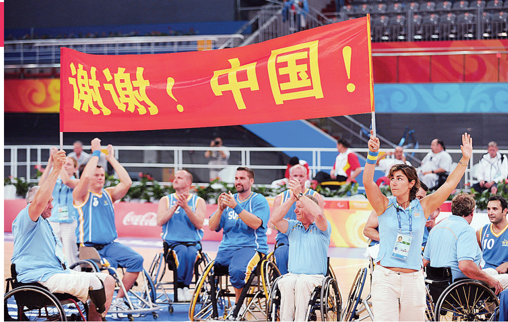
9月9日,瑞典队球员在赛后打出“谢谢,中国!”的横幅。当日,在国家体育馆举行的北京2008年残奥会轮椅篮球男子预赛A组的比赛中,瑞典队以52:62负于加拿大队。

看着残疾运动员的比赛,我们心中对他们充满了敬意,太多的话语已咽到肚里。残奥会才刚刚开始,种种感人的场面只是一个小插曲,相信在以后的比赛中会有更多感动的瞬间让我们铭记。不以成败论英雄,能站在残奥会这个大舞台上,对残疾人来说已经是成功的了,在这个大舞台上相信他们会尽情地表现自己。看着他们的比赛有一种什么也不想说的感觉,只觉得脚步更加轻盈了,工作更加有劲了,心中的目标更加坚定了,前方的路更加明亮了。因为他们的精神已经在不经意间影响了自己。 陈凯