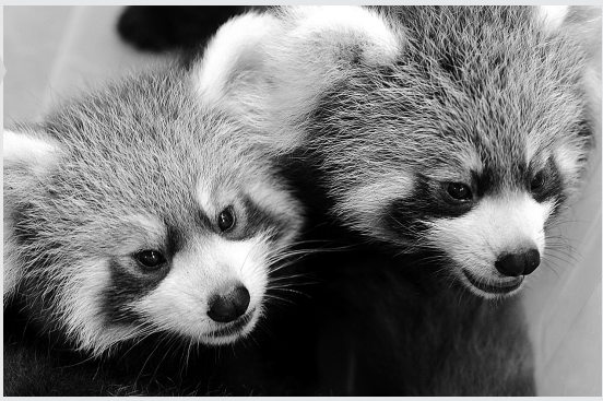
10日,福州大熊猫研究中心的一对双胞胎大熊猫幼仔在饲养箱中等待与公众见面。当日,福州大熊猫研究中心对今年繁殖成活的8只幼年大熊猫进行了集中展示,并进行现场饲养活动。

北京时间2008年9月10日9时14分,在西藏日喀则地区仲巴县(北纬31.0度,东经83.6度)发生5.1级地震;9时28分,这一区域再次发生5.2级地震,震区平均海拔约5000米,人烟稀少。