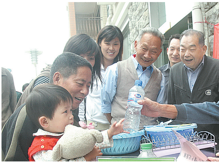
陇海大院 爱心群体

为使活动深入持久地进行下去,吉祥花园社区还在每个小区聘请了“复审员”、“发放员”和“记