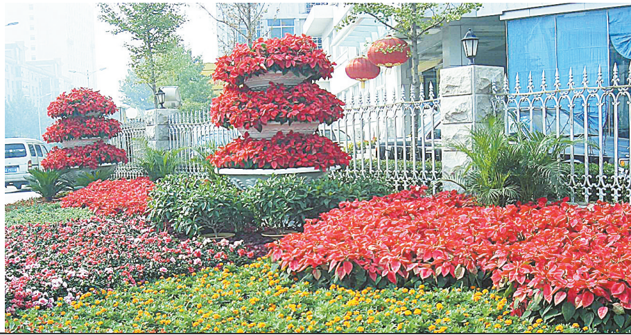
国庆节将近,二七区绿化管理所精心装扮嵩山路等路段及辖区各路口。截至昨日,共摆放三角梅、散尾葵、彩叶草、国庆菊等近20个品种,50万余盆鲜花。