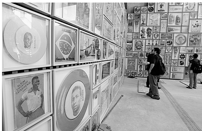
9月23日，参观者在巴西足球博物馆内观看展品。当日，即将于本月29日正式开放的巴西足球博物馆向媒体敞开了大门，首个展览是向“球王”贝利致敬的“贝利事迹展”。

据了解，自2004年以来，少林功夫表演团已分赴巴西、瑞士、韩国、南美、墨西哥等国家和地区进行演出，成为对外宣传中国的主要文化名片之一。