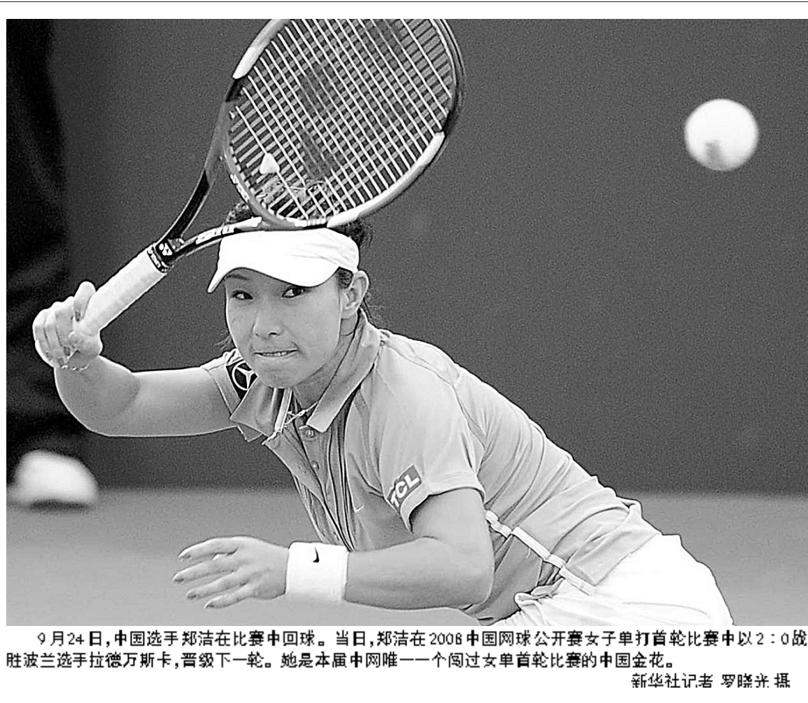
9月24日，中国选手郑洁在比赛中回球。当日，郑洁在2008中国网球公开赛女子单打首轮比赛中以2:0战胜波兰选手拉德万斯卡，晋级下一轮。她是本届中网唯一一个闯过女单首轮比赛的中国金花。