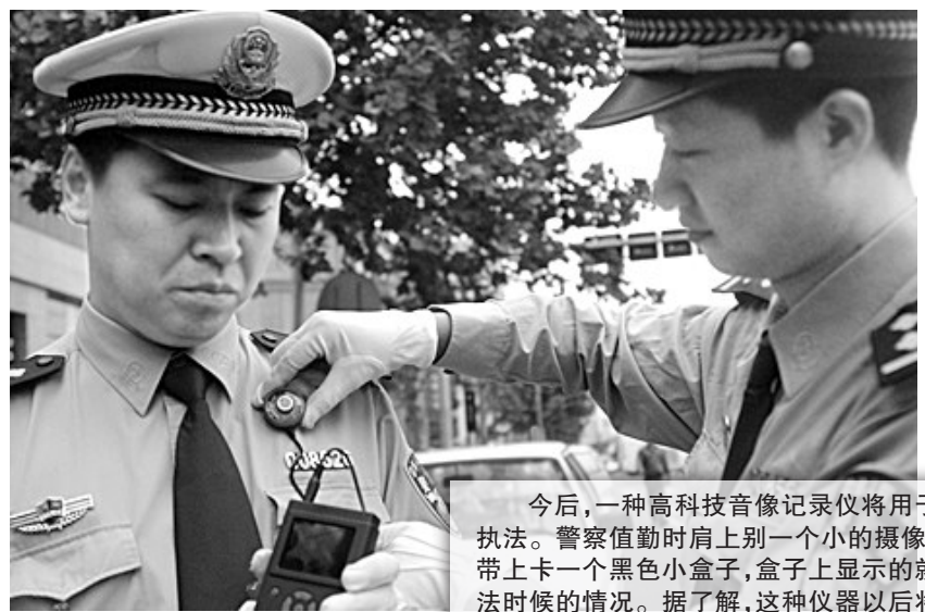
今后,一种高科技音像记录仪将用于交警执法。警察值勤时肩上一别一个小的摄像头,皮带上卡一个黑色小盒子,盒子上显示的就是执法时候的情况。据了解,这种仪器以后将逐步推行。

注重制度建设的角度着手,就领导干部如何过好权力关、家庭关和美学关这三个关键关口问题,给与会人员进行了一堂反腐倡廉教育课。为不断提升我市纪检监察系统领导干部的业务素质、工作能力,市纪委会常委会决定,组织委局机关和市直派驻机构近几年任职的县处级干部进行短期集中培训。在为期一周的封闭培训中,还将邀请有关专家、学者为学员授课。