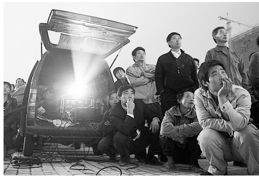
市民在聚精会神地看电影。