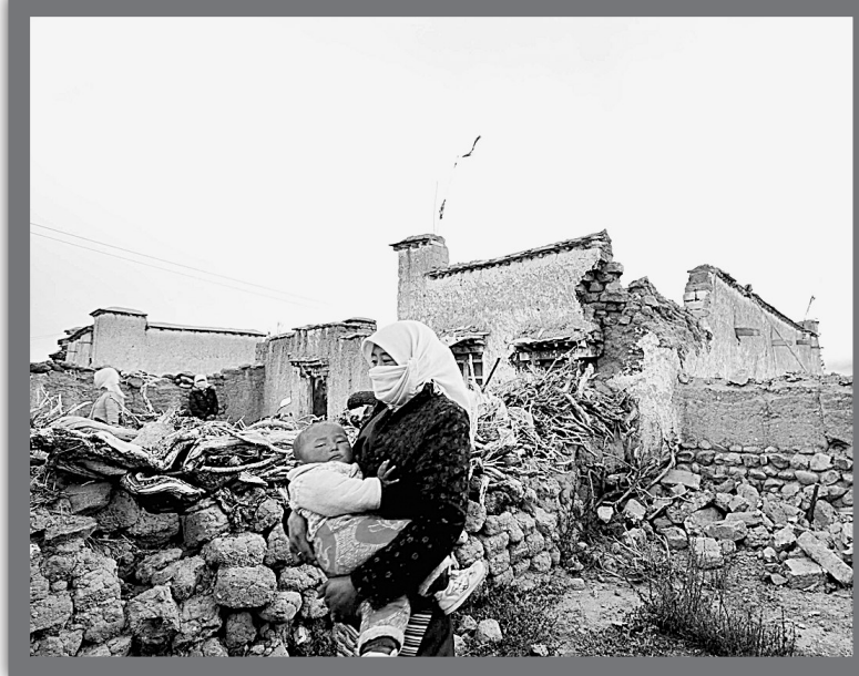
10月6日,西藏当雄县羊八井镇格达乡格达村的一名牧民带着孩子从倒塌的房前走过。

记者6日18时20分在前往当雄地震震中的路上看到,震后的首列进藏列车刚刚通过羊八井一号隧道,说明青藏铁路未受到地震的影响,火车