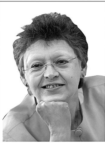
弗朗索瓦丝·巴尔-西诺西(法国)

物理学奖:格林尼治时间7日9时45分,北京时间7日17时45分;化学奖:格林尼治时间8日9时45分,北京时间8日17时45分;文学奖:格林尼治时间9日11时,北京时间9日19时;和平奖:格林尼治时间10日9时,北京时间10日17时;经济学奖:格林尼治时间13日11时,北京时间13日19时。