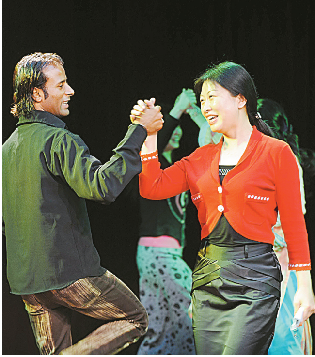
巴基斯坦民族艺术团