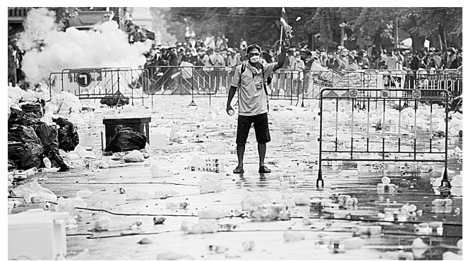
10月7日晚,泰国警方与围困国会的反政府示威者之间爆发激烈冲突。截至当地时间7日晚,冲突造成至少2人死亡、358人受伤。