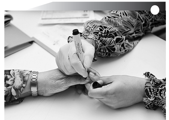
10月8日,在马尔代夫首都马累的一处投票站,工作人员为参加投票的选民进行标记。当地时间10月8日上午9时,马尔代夫历史上首次多党总统大选的第一轮投票开始,投票将持续12小时,直至当地时间晚上9时结束。本次投票结果将于10月9日公布。

此前,美国政府财政赤字最高纪录是2004年创下的4130亿美元。2007年,美国政府财政赤字仅为1620亿美元,为2002年以来最低水平。