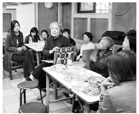
昨日,大学路办事处邀请45名改革开放“见证人”和青年座谈,以亲身经历讲述改革开放给百姓生活带来的巨大变化,教育青年人珍惜今天来之不易的幸福生活。

舞蹈《手舞四季》由28名聋人大学生通过手语描绘大自然美丽的春夏秋冬,以此表达对祖国和家乡的热爱之情,是本次大赛中唯一一个由残疾人大学生表演的节目。