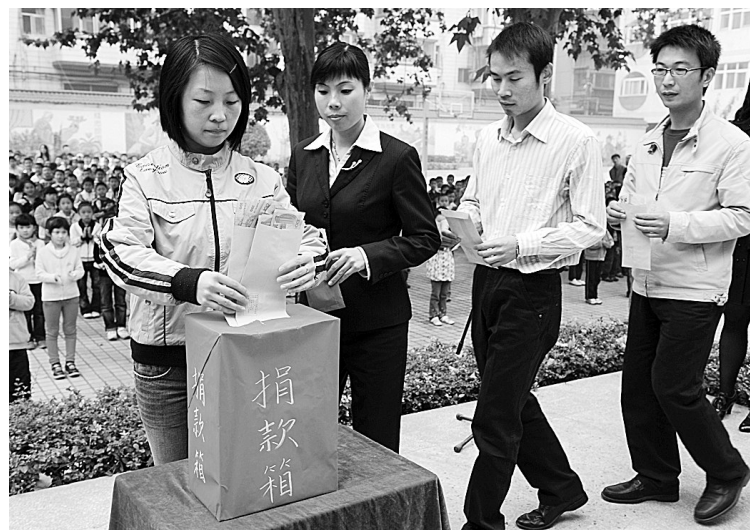
10月16日是我市第一个“慈善日”。连日来,我市各区中小学纷纷行动起来,老师捐出一天工资,学生捐出一天零花钱,尽己所能,奉献爱心。