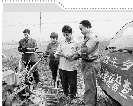
进入三秋季节以来,登封市唐庄乡认真做好秋季秸秆焚烧和综合利用工作,出动流动宣传督查车,深入到田间地头大力宣传秸秆焚烧的危害和综合利用的措施,有效防止了违法焚烧秸秆现象。图为工作人员在唐西村发放宣传综合利用秸秆宣传材料。

和生活型服务业为两翼,结构合理、功能完善的现代服务业体系;将以新理念推进农业发展新跨越,坚持用工业理念谋划农业,加强政策扶持、龙头带动和市场引导,积极调整农业区域布局,推进农业产业化经营,搞好农业基础设施建设,完善农业服务体系,促进农业由数量型增长向质量效益型增长转变,由产品型增长向商品型增长转变;将以新思路推动城乡发展新跨越,坚持公共财政向农村倾斜,基础设施向农村延伸,社会事业向农村侧重,实施城乡规划编制一体化、城乡基础设施建设一体化、城乡社会建设一体化、城乡管理一体化,努力构建城乡互动发展的长效机制,实现城乡统筹协调发展。