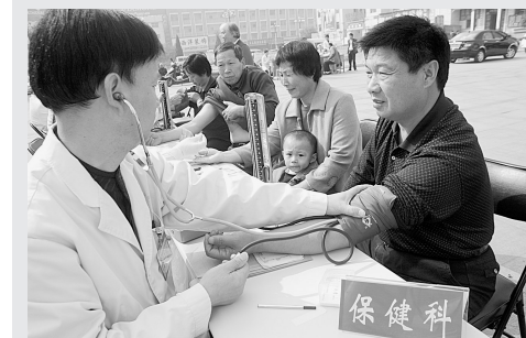
10月12日,登封市卫生局启动“万名医护送健康”活动。活动期间将在登封市开展“登封市健康大讲堂”、“登封市健康服务车”、“万名医师支援农村卫生工程”等活动内容。图为启动仪式上医护人员开展义诊咨询服务。

捐赠仪式结束后,村民李延升激动地说,他非常喜欢看农业种植类的图书,这次他们有了自己的“农家书屋”,就可以足不出户,靠科技种地了!