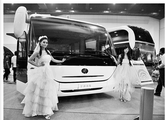
2008中国中部国际客运车辆展示采购会昨日在郑州国际会展中心开幕。展会由中国交通运输部主办,包括宇通在内的多家客车、卡车企业盛装参会,展示采购将于18日结束。图为宇通公司在展会上亮相的新车型。

通过计算机定税系统,增强了税收执法透明度,避免了暗箱操作和“人情税”、“关系税”,保证纳税人税收定额核定的公平、公正、公开,有效提升了纳税服务水平。纳税核定后,国税局还通过纳税服务网、公告栏对每个纳税人的纳税情况进行公布,接受纳税人与社会的广泛监督。