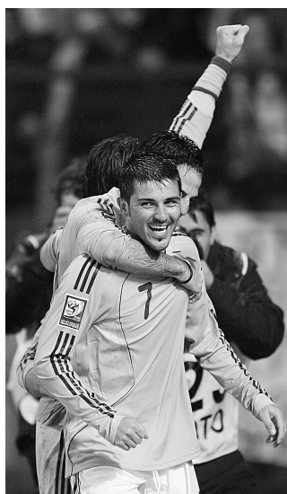
西班牙队球员比亚拉攻入一球后与队友庆祝。