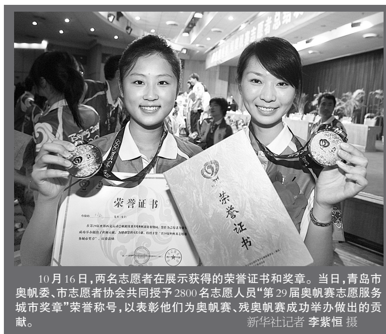
10月16日,两名志愿者在展示获得的荣誉证书和奖章。当日,青岛市奥帆委、市志愿者协会共同授予2800名志愿人员“第29届奥运会志愿服务城市奖章”荣誉称号,以表彰他们为奥帆赛、残奥帆赛成功举办做出的贡献。

如果中国队能够拿下这枚男子团体金牌,就能实现赛前提出的包揽首届智运会象棋全部五枚金牌的目标。在此前的比赛中,年轻棋手汪洋夺得男子快棋金牌,男女个人冠军分别被许银川和王琳娜获得,女子团体的金牌也已被中国队收入囊中。