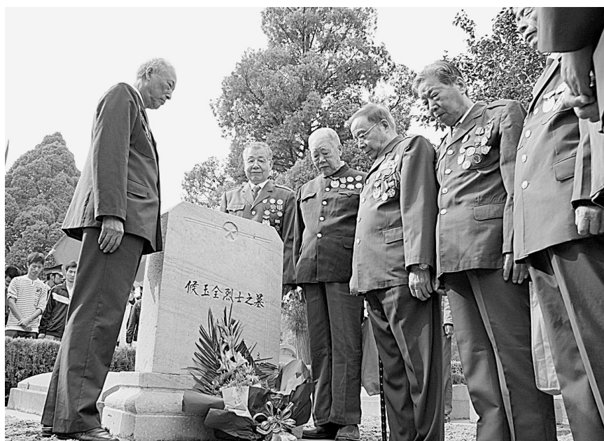
郑州解放60周年前夕,部分解放郑州老战士来到烈士陵园,和河南财经学院、郑州交通职业学院等高校的师生一起,共同缅怀为解放郑州英勇捐躯的革命烈士。