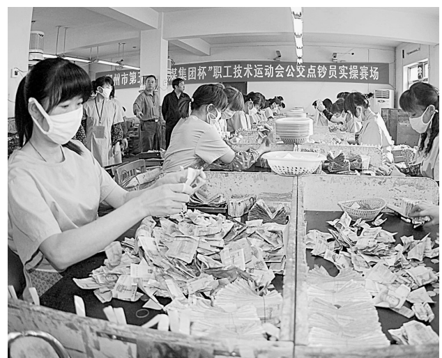
市公交总公司近日举行公交职工技能竞赛,项目包括点钞、汽车驾驶和维修、电车故障排除等。通过技术练兵,努力打造公交企业“金蓝领”。

另外,经过检查组工作人员实地节能检测,今年,我市10个项目申报国家节能技术改造财政奖励,也顺利通过核查。