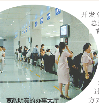
宽敞明亮的办事大厅