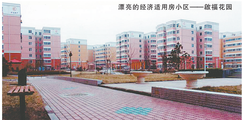
漂亮的经济适用房小区——啟福花园