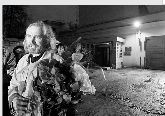
21日,俄罗斯前财政部副部长谢尔盖·斯托尔恰克在莫斯科被释放后接受采访。当日,俄罗斯释放斯托尔恰克,并未对其作出判决。斯托尔恰克2007年11月入狱,被控套取联邦财政资金。

印度空间研究组织于2003年提出“登月计划”,共分三个阶段实施。“月船1号”的发射是第一步。接下来,印度准备在2011年实施“月船2号”项目,向月球发射绕月探测器,并使一个机器人车在月球表面实现软着陆。第三步,2025年实现印度宇航员登月。此外,印度计划2015年将首名宇航员送入太空。