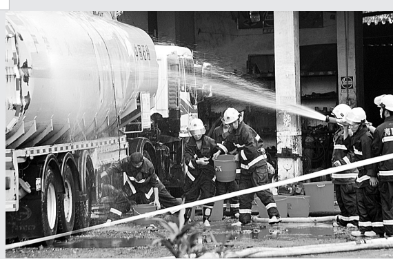
22日,在油罐车爆炸现场,消防人员对油罐车进行降温等紧急处理。当日9时20分,一辆油罐车在海南省澄迈县琼城汽修厂维修时发生爆炸,3人当场死亡,5人受伤,其中1名伤者生命垂危,爆炸原因正在调查中。