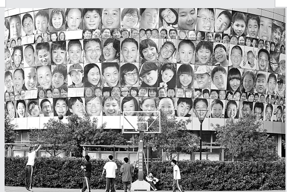
22日,几名学生在“笑脸墙”下打篮球。日前,一面近400平方米的“笑脸墙”在南京金陵中学河西分校亮相,从校园征集的272个学生的笑脸照片印在了墙上。校方希望用这种方式展现学生生活四射的精神面貌,营造轻松快乐的学习氛围。