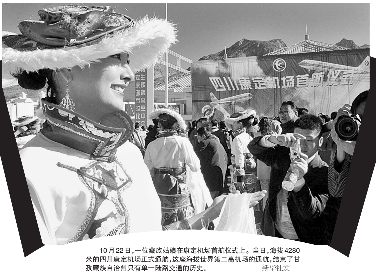
10月22日,一位藏族姑娘在康定机场首航仪式上。当日,海拔4280米的四川康定机场正式通航,这座海拔世界第二高机场的通航,结束了甘孜藏族自治州只有单一陆路交通的历史。

记者是从22日在山东召开的全国优抚医疗保障工作会议上了解到这一信息的。民政部优抚安置局局长孙绍聘介绍,中央财政为此年增加抚恤补助经费26.8亿元。