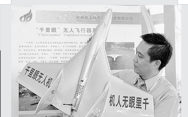
22日,工作人员在展示介绍千里眼无人机。当日,第五届中国—东盟博览会在南宁开幕。三架曾在今年雪灾、洪涝和汶川地震等灾区执行救灾航拍任务的千里眼无人机在南宁国际会展中心亮相,吸引了许多观众的目光。