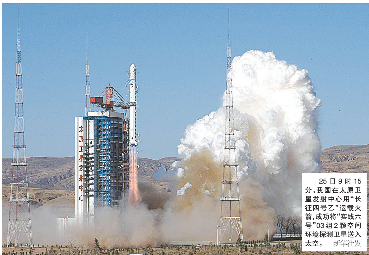
25日9时15分,我国在太原卫星发射中心用“长征四号乙”运载火箭,成功将“实践六号”03组2颗空间环境探测卫星送入太空。