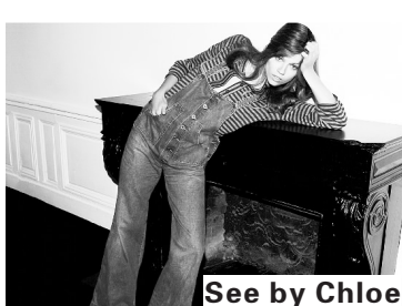
See by Chloe

以简洁却十分突出的线条感来架构服装,并将剪裁与颜色两者完美契合,使穿着者展现更佳的身型轮廓,其服装包含套装、连衣裙、晚礼服、上班服装、针织衣、游泳衣、户外休闲系列。Gianfranco Ferre只向未来瞻望而不画地自限,致力于开发新的风格视野给消费者。