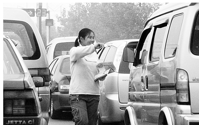
在车流量大的路段,经常可以看到“发卡族”穿梭其间,既危险又影响交通。昨日,特巡警三大队开展专项行动,打击清理发卡人员。本报记者 宋晔 摄

抚恤救助金发放仪式上,我市因公牺牲的民警陈根章、王立新两人家属各获得10万元特别补助,刘玉山等21名重症民警各获医疗救助金2~3万元,蔡华威等6名因公伤残民警各获救助金1000元~2万元,竹卫东的女儿竹筠等3名公安英烈、因公牺牲或伤残及特困民警子女分获500元和1000元助学金。