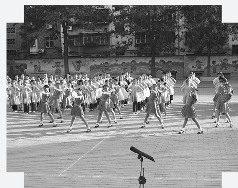
在刚刚结束的由郑州市教育局主办的首届疯狂背古诗大赛中，互助路小学获得总分第一名的好成绩。