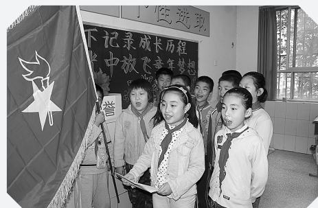
管城外国语学校近日开展了“童心飞扬——成长记录台记录我的成长”主题活动。少先队员们记录台前，纷纷讲述了自己的成长经历，表达了自己要为梦想而奋斗的决心。