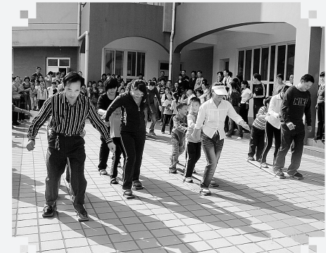
近日，郑师附小英协外语小学迎来了2008年第一屆秋季“小学生趣味运动会”，其中的亲子比赛项目让比赛现场热闹非凡。