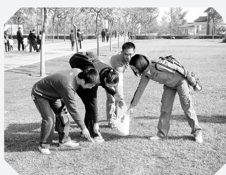
10月27日，金水区实验小学组织青年教师做文明志愿者，他们来到市区广场和郑州世纪欢乐园园区，引导市民文明出行，清理公共场所的白色污染，为郑州市的城市文明贡献力量。