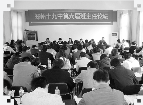
10月25、26日，郑州十九中第六班主任论坛在巩义浮戏山隆重召开。本届班主任论坛以“班主任话细节”为主题。