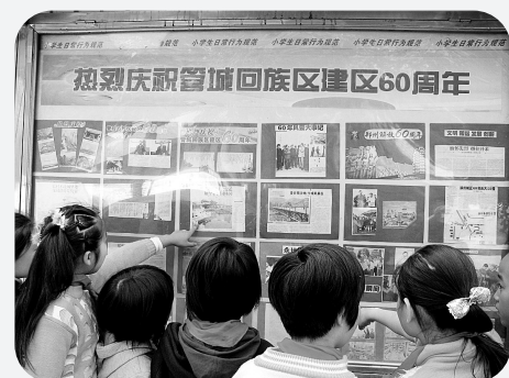
管城区回民第一小学在区庆60周年之际，号召同学们搜集资料，制作成宣传板块，通过图片展览，让学生了解管城发展的历史。