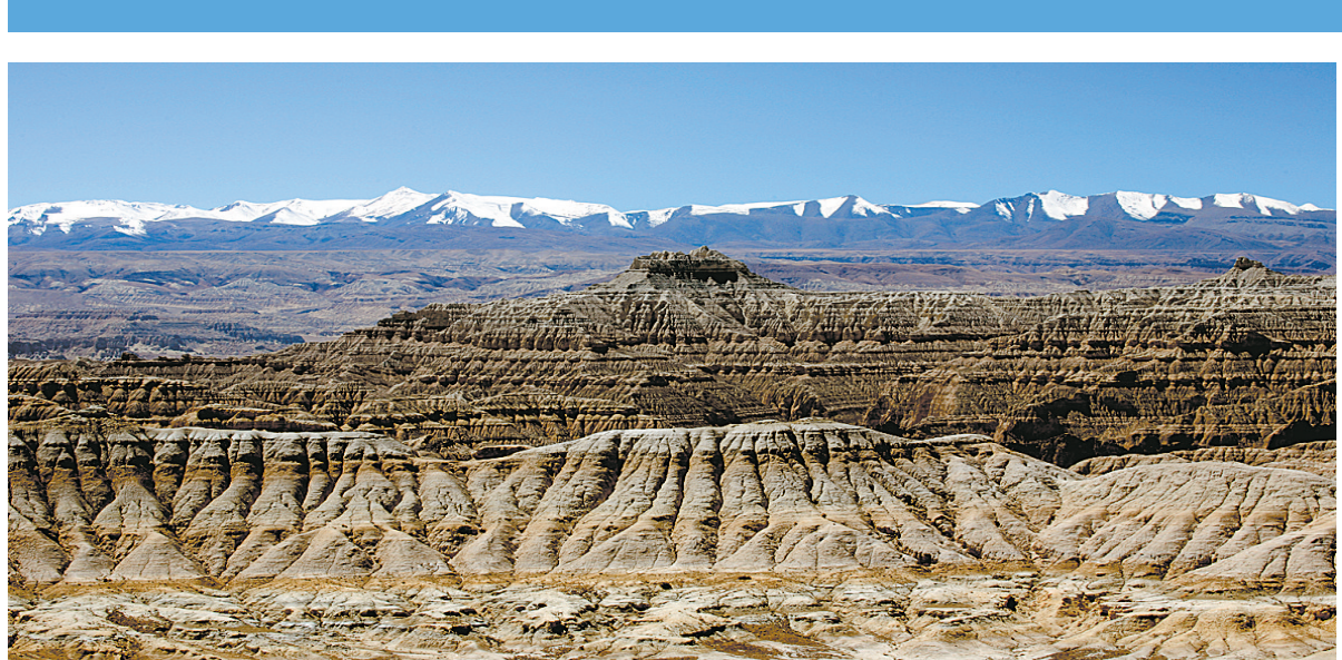
西藏阿坝地区札达县土林