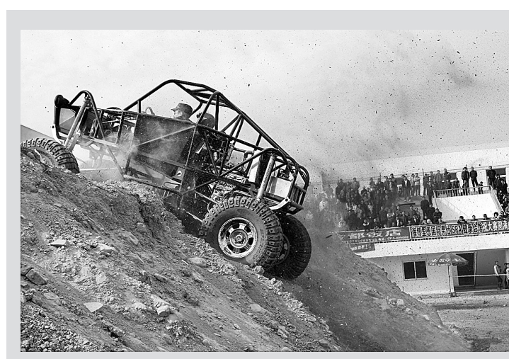
8日，车手驾驶“攀岩车”进行爬坡表演。当日，河北省第六届汽车场地赛暨邯郸市汽车运动文化节在邯郸拉开帷幕。邯郸生产的一款时速可达60公里，适用于沙漠、山地、丘陵等复杂地形的野外“攀岩车”吸引了观众目光。 新华社发

上图7日，在海地坍塌的教会学校，一名男学生被压在校园的废墟下奄奄一息。 新华社发