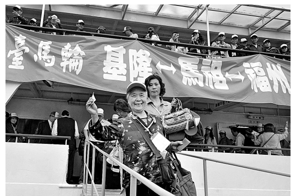
11月8日，安全抵达福州马尾港的台湾游客走下客轮。当日，从台湾基隆港出发并停靠马祖福澳港的“台马”号客轮，经过10多个小时的航程后，安全抵达福州马尾港。这是“两马”海上客运航线首次延伸至台湾本土。